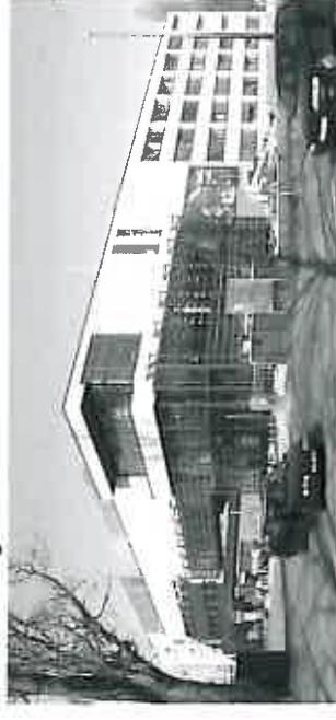
"Leipziger Kubus" Helmholtz-Zentrum für Umweltforschung - UFZ Permoserstraße 15, 04318 Leipzig

Landesgütige Gemeinschaft Instandsetzung von Betonbauwerken Sachsen und Sachsen Anhalt e.V. Neüänder Straße 29 01129 Dresden