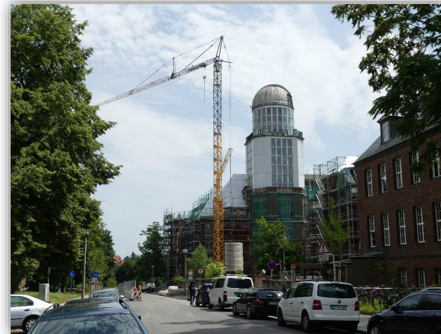
Bauhauf GmbH / St. Gobain-Weber Erlwein Berufsschule Dresden Instandsetzung + Verstärkung historischer Betondecken