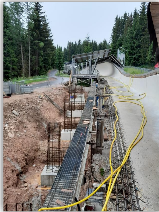
Trinitz Bauwerksanierung GmbH Instandsetzung der Bobbahn Altenberg