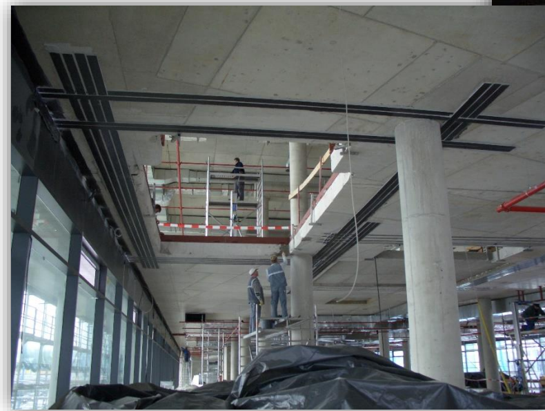
Verstärkung von Bauwerken z. B. für Nutzungsänderung