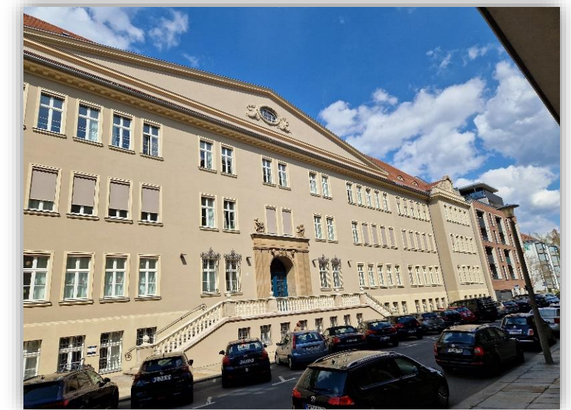
HWP Massenberg Dresden, CARBOCON Instandsetzung mit Carbonbeton