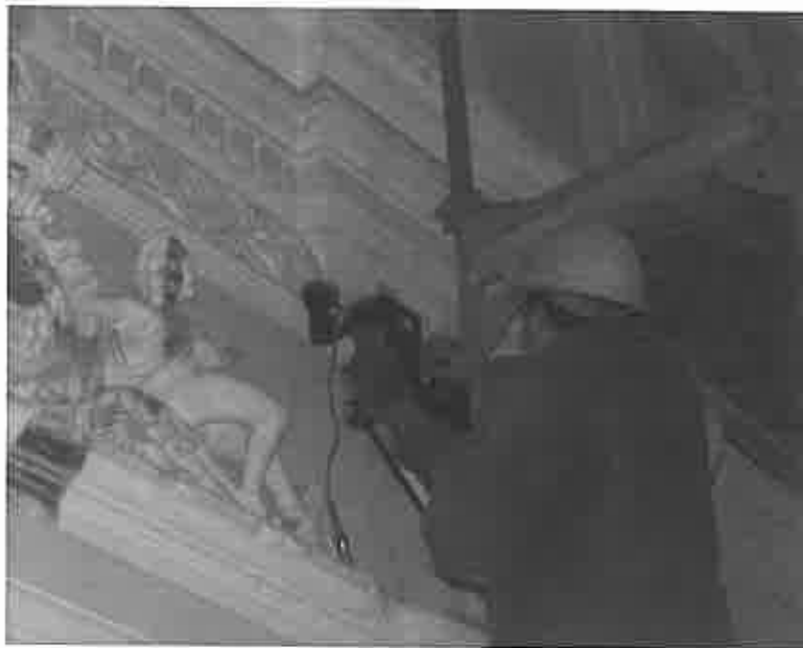
Abbildung 3. Ortung von Lüftungskanälen und Schichtgrenzen im Mauerwerk auf einer denkmalgeschützten Stuckfläche

Zur großflächigen Erkennung und Bewertung der Gleichartigkeit der tragenden Strukturen oder Aufbauten (Decken oder Wänden) auf tragenden Strukturen bei der Bestandserfassung oder Bauwerksdiagnose kann ebenfalls das Radarverfahren eingesetzt werden. Mit Radar gelingt die Auflösung von Deckentragsystemen auch unter Bodenaufbauten, da die elektromagnetischen Radarwellen auch bei einseitiger Zugänglichkeit die Baustoffe durchdringen und Informationen von darunter liegenden Schichten liefern kann. Auch für Mauerwerksuntersuchungen eignet sich das Radarverfahren besonders, da es dicke Mauerwerkschichten durchdringt und einzelne Schichten auflöst und dabei ohne direkte Ankopplung auf der Bauteiloberfläche eingesetzt werden kann. Dies kann insbesondere beim Denkmalschutz von zentraler Bedeutung sein (Abb. 3).