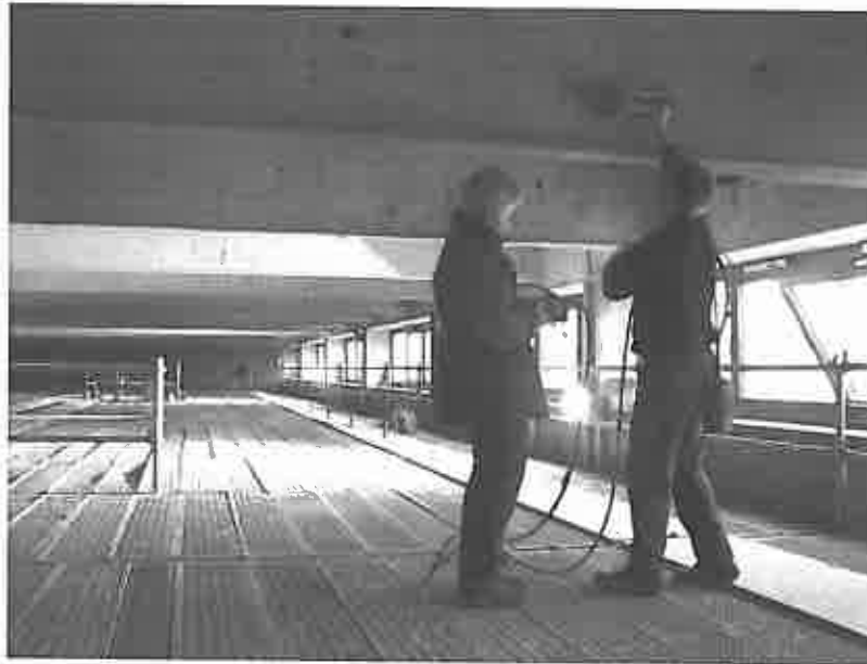
Abbildung 1. Ortung von Spanngliedern und Hohlstellen in Spannbetonbindern einer Sporthalle

erforderliche Flexibilität bei der Untersuchung von Untersuchungsplattformen oder von Hubsteigern schließt den Einsatz von schienengeführten Systemen oder insbesondere von scannenden Systemen aus. Wegen des vergleichsweise einfachen Informationsgehaltes, der dabei erforderlich ist (laterale Lage, Tiefenlage oder Schräglage der Verdrängungsrohre), ist auch kein scannendes Verfahren erforderlich und wirtschaftlich interessant (Abb. 2).