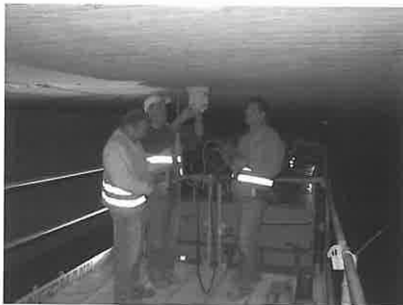
Abbildung 2. Ortung von Verdrängungskörpern in einer Brücke über einer Bahnlinie

Gleichartige Messungen werden beispielsweise auch bei Verdrängungskörpern, die durch verlorene Holzschalung hergestellt wurden, durchgeführt. Durch den Übergang der Radarewelle vom Beton in den Luftraum (geringe Dichte und hohe Wellengeschwindigkeit) ist die Reflektion an der Schichtgrenze vergleichsweise schwach und damit schwerer interpretierbar. Wird eine Aussage über eine mögliche Wasserfüllung der Hohlräume gefordert, bietet das Radarverfahren Vorteile, weil der Unterschied zwischen der Reflektion zum luftgefüll-