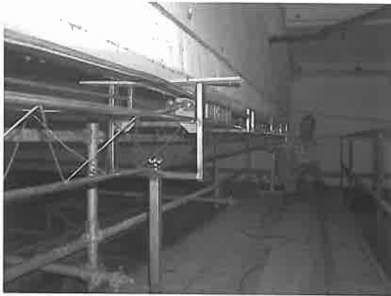
Abbildung 4. Spannstahl-Rissortung mit dem schienengeführten Magnetfeldverfahren

Mit dem Remanent-Magnetfeldverfahren lassen sich Risse in Spannstählen, auch von Spanndrähten und Spannstählen in metallischen Hüllrohren nachweisen. Der Einsatz des Messwagens, in dem die Magnetisiereinheit und die Sonden zur Erfassung des Magnetfeldes untergebracht sind, erfolgt dabei in Schienensystemen (Abb. 4). Bei gekrümmt verlaufenden Spanngliedern müssen die Schienensysteme dem Spanngliedverlauf angepasst werden. Mit der Entwicklung dieses Verfahrens gelang der Übergang zu schienengeführten und scannenden Systemen, die zwischenzeitlich durch weitere Entwicklungen ergänzt wurden.