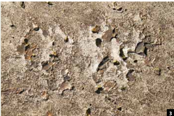
Abb. 3: Mangelhafte Verarbeitung und der fehlende Oberflächenschutz waren die Ursachen für Schäden an der Fassade. Neben Rissen und Kiesnestern, die sich an der Fassade zeigten,...

Mit der Instandsetzung beauftragte man das Wuppertaler Unternehmen Dirk Hün-