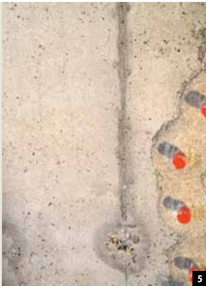
Abb. 5: Feuchtigkeit konnte in das Gebäudeinnere eindringen. Hier sammelt sich Kondensat an der Wand, die sich ursprünglich hinter einer ungedämmten Bekleidung befand.