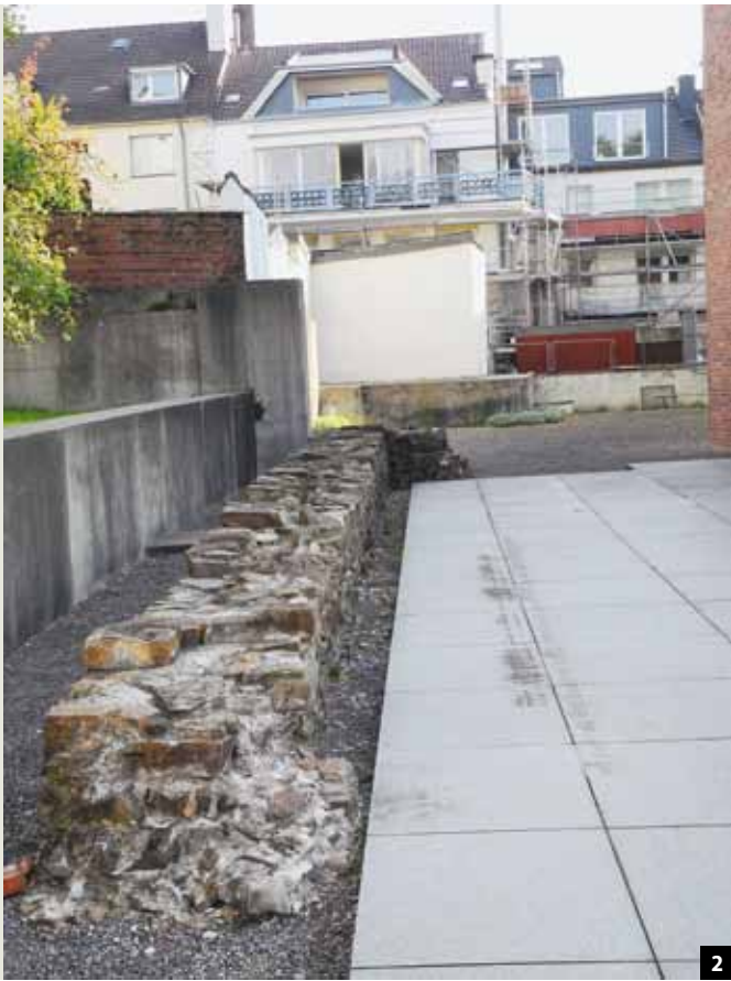
Abb. 2: An der nördlichen Grundstücksgrenze erinnern Teile der Grundmauern an die ursprüngliche Synagoge und ihre Zerstörung in der Reichskristallnacht am 9. November 1938.

ninghaus GmbH. Dabei bestand die Hauptaufgabe darin, das Objekt gegen eindringende Feuchte abzudichten.