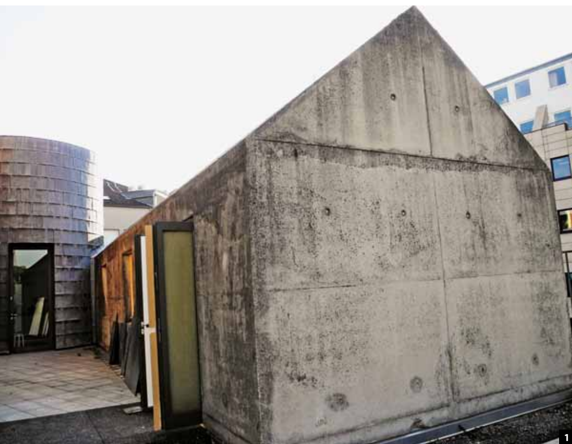
Abb. 1: Das Nebengebäude der jüdischen Begegnungsstätte „Alte Synagoge“ wies Schäden durch eindringende Feuchtigkeit auf.