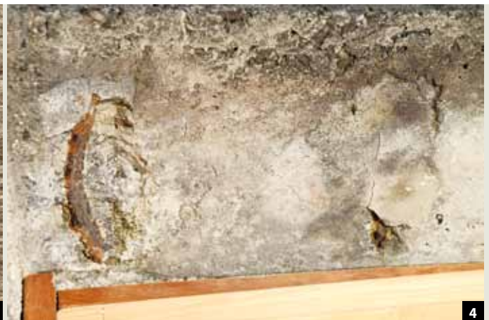
Abb. 4: ... lag an einigen Stellen bereits die Bewehrung frei.