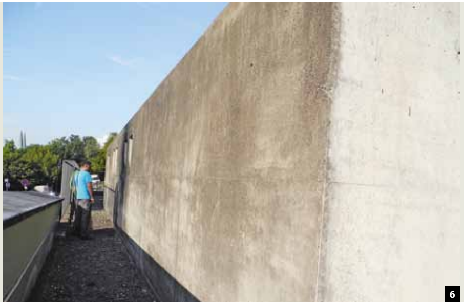
Abb. 6: Auf der Oberfläche der Außenwand hatte sich eine graue Patina gebildet.

ser- und wasserdampfdichten Schaumglasdämmung auszuführen. Der Wandaufbau verhindert einen Wassereintritt von außen in das Objekt, entspricht der vorgeschriebenen Wärmedämmung und stellt gleichzeitig sicher, dass aus dem Innenraum kein Wasserdampf in die Dach- beziehungsweise Wandkonstruktion gelangt. Abschließend sollte die Konstruktion ein dünnschichtiges organisches Putzsystem erhalten.